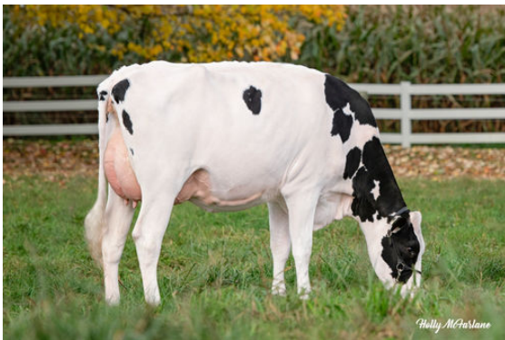
FRAELAND ALLIGATOR BOMBAY DAM