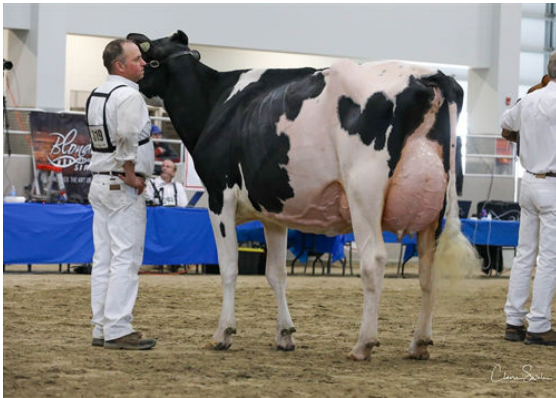
FRAELAND DOORMAN BOURBON GRANDDAM